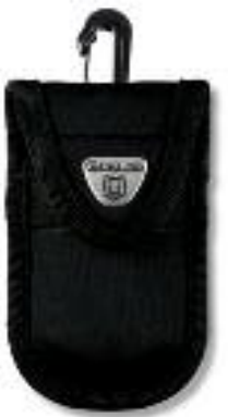
4.0852 Műanyag tok, fekete