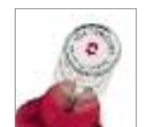
A.7090 Labda jelölő