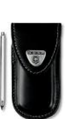
4.0853 Bőr tok, fekete öv klipsszel és töltőceruzával